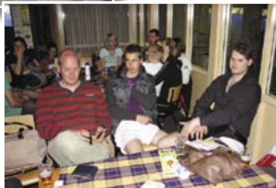
Nazitten na het Transporttoernooi in de kantine met een welverdiend drankje