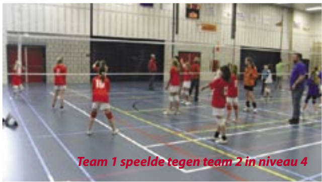
Team 1 speelde tegen team 2 in niveau 4

Als laatste speelden de meiden van niveau 6 . Zij hadden het erg moeilijk tegen de teams van Simokos, die dan ook bovenaan staan, maar in de derde set ging alles prima, en werd er dik gewonnen. De competitie was gespeeld, en de winnaars bekend: Simokos besloeg de eerste 3 plaatsen en Urbanus werd prima vierde in de A-poule. Al met al weer een gezellig dagje, waar iedereen met een mooie medaille naar huis ging.