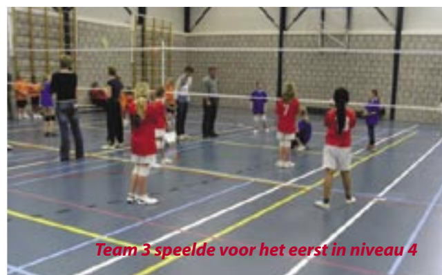
Team 3 speelde voor het eerst in niveau 4

Bij niveau 3 deden we met 1 team mee. Het andere team was doorgeschoven naar niveau 4. In niveau 3 spelen 2 jongens en 3 meiden voor de eer, en ook zij werden prachtig tweede .